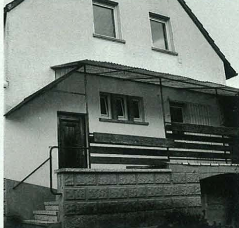
Früher Ausgerechnet an die Fassade mit dem Hauseingang, üblicherweise so gut wie tabu...