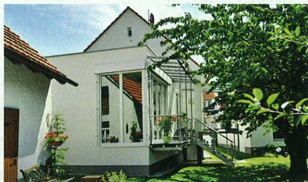
Heute ...dockte der Architekt den Anbau an: Wohnraum gewonnen, Garten elegant erschlossen.