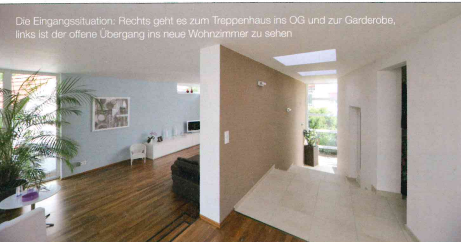
Die Eingangssituation: Rechts geht es zum Treppenhaus ins OG und zur Garderobe, links ist der offene Übergang ins neue Wohnzimmer zu sehen

der Straße aus sichtbare Teil des Anbaus. Dieser Anbau wurde als Holzkonstruktion vom Zimmermeisterhaus-Partnerbetrieb Schmidt aus dem hessischen Lauterbach-Maar ausgeführt.