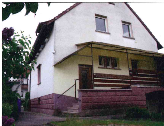
Der Hauseingang lag schon immer abgewandt von der Straße. Hier dockt der neue Anbau an und erstreckt sich in den Garten