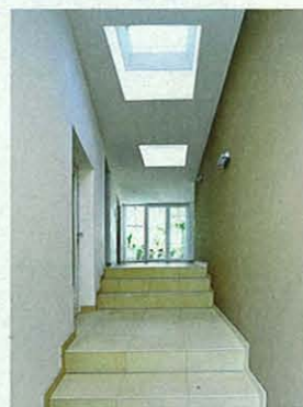
Nahtstelle Die Außen-treppe sitzt plötzlich im Flur...