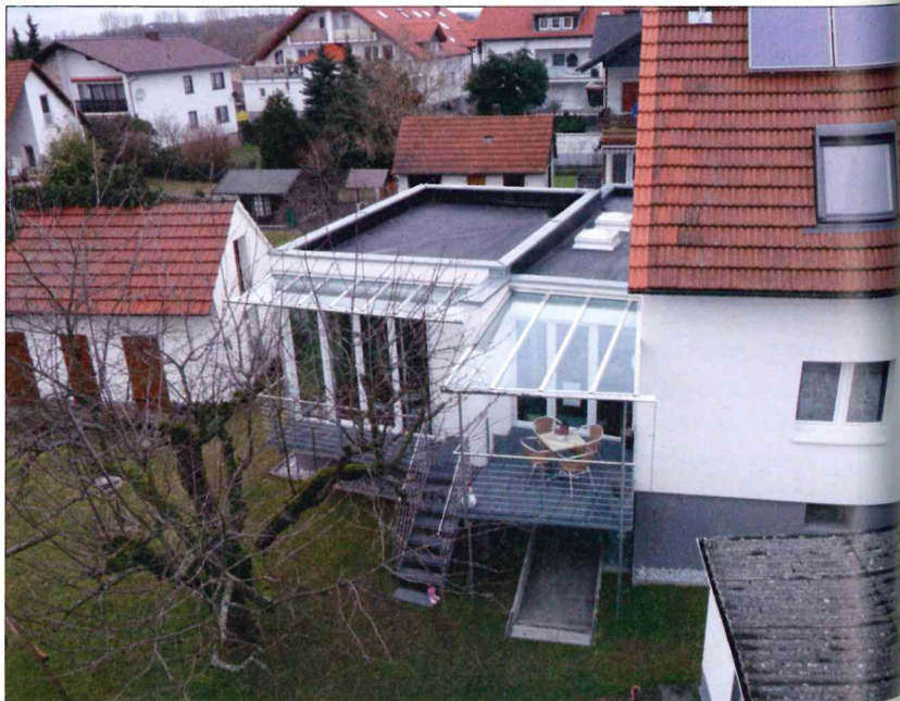
Im Winter gut zu fotografieren: die Terrassenseite des Anbaus gegenüber vom Eingang