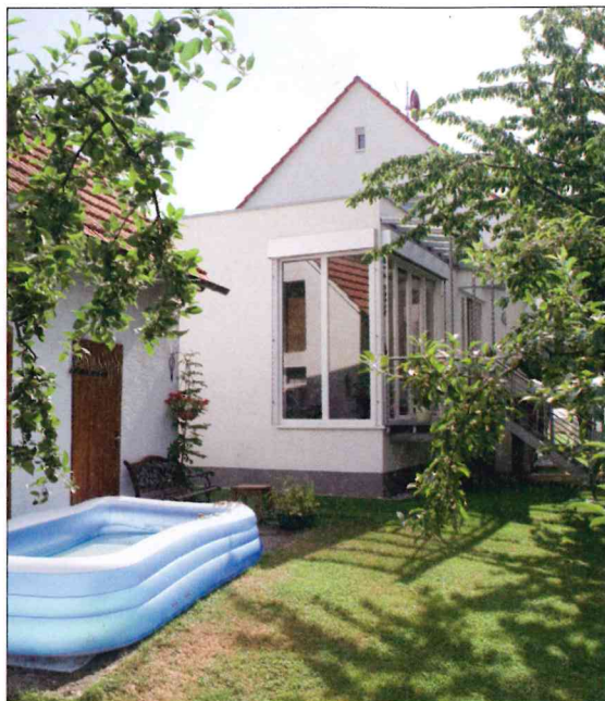
Im Sommer sitzt man im Anbau mitten im Grün